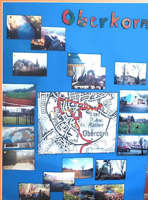
Arbeit der Klasse Claude Floener Oberkorn